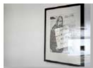
Fuera de la Puerta 11 Appropriation Art. Serie Fuera de la Puerta Appropriation: Berlin - Galerie Klosterfelde - Matthew Antezzo Precio: 150 €( sin marco) 200 € (con marco).