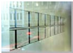
Fuera de la Puerta 5 Appropriation Art. Serie Fuera de la Puerta Appropriation: Frankfurt/ Main - Galerie Eva Winkeler - Matthias Meyer Precio: 150 €( sin marco) 200 € (con marco).