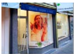
Fuera de la Puerta 7 Appropriation Art. Serie Fuera de la Puerta Appropriation: Frankfurt/ Main - Galerie wagner + marks - Inna Artemova Precio: 150 €( sin marco) 200 € (con marco).