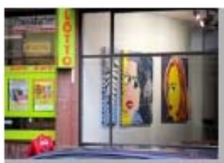
Fuera de la Puerta 1 Appropriation Art. Serie Fuera de la Puerta Appropriation: Frankfurt/ Main - Galerie Hübner + Hübner -Thomas Böing Precio: 150 €( sin marco) 200 € (con marco).