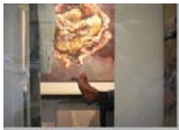
Fuera de la Puerta 6 Appropriation Art. Serie Fuera de la Puerta Appropriation: Frankfurt/ Main - Galerie mühlfeld + stolher - Eberhard Bitter Precio: 150 €( sin marco) 200 € (con marco).