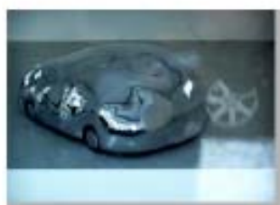
Fuera de la Puerta 8 Appropriation Art. Serie Fuera de la Puerta Appropriation: Frankfurt/ Main - Galerie Hübner + Hübner - Thomas Böing Precio: 150 €( sin marco) 200 € (con marco).