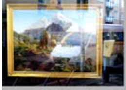
Fuera de la Puerta 3 Appropriation Art. Serie Fuera de la Puerta Appropriation: Frankfurt/ Main - Gallerie Maurer - beautiful Illusion Precio: 150 €( sin marco) 200 € (con marco).