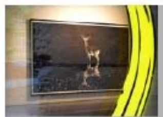
Fuera de la Puerta 10 Appropriation Art. Serie Fuera de la Puerta Appropriation: Cologne - Galerie Stefan Röpke - Aleksandar Duravcevic Precio: 150 €( sin marco) 200 € (con marco).