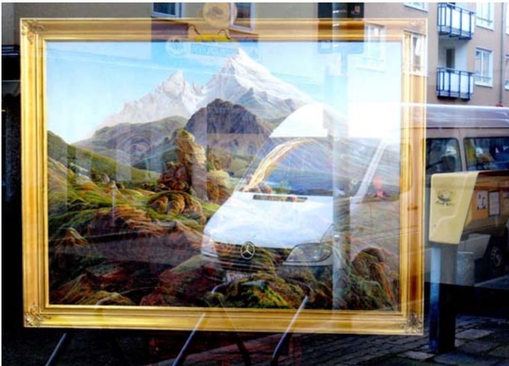
Fuera de la Puerta 3 Appropriation Art. Serie Fuera de la Puerta Appropriation: Frankfurt/ Main - Galerie Maurer - beautiful Illusion Precio: 150 €( sin marco) 200 € (con marco).