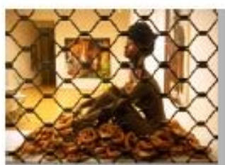
Fuera de la Puerta 9 Appropriation Art. Serie Fuera de la Puerta Appropriation: Frankfurt/ Main - Frankfurter Kunstkabinett Hanna Bekker vom Rath - Elvira Bach Precio: 150 €( sin marco) 200 € (con marco).