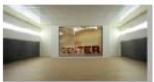
Fuera de la Puerta 12 Appropriation Art. Serie Fuera de la Puerta Appropriation: Frankfurt/ Main - Galerie Jacky Strenz - Kunsthalle Gieben + Pietro Sanguineti Precio: 150 €( sin marco) 200 € (con marco).