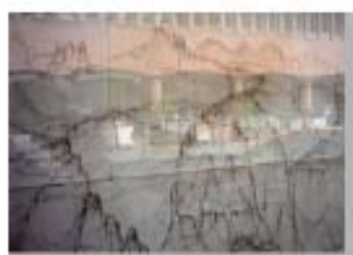
Fuera de la Puerta Appropriation Art. Serie Fuera de la Puerta Appropriation: Frankfurt/ Main - Galerie Friedrich Müller - Raffi Kaiser Precio: 150 €( sin marco) 200 € (con marco).