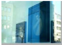
Fuera de la Puerta 4 Appropriation Art. Serie Fuera de la Puerta Appropriation: Frankfurt/ Main - Voges Gallery - Alexander Tinei Precio: 150 €( sin marco) 200 € (con marco).