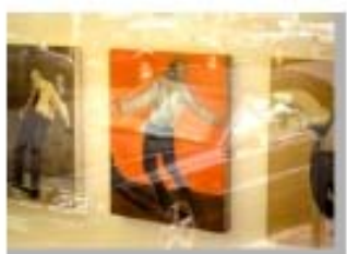
Fuera de la Puerta 2 Appropriation Art. Serie Fuera de la Puerta Appropriation: Frankfurt/ Main - Galerie Greulich- Casey McKee Precio: 150 €( sin marco) 200 € (con marco).