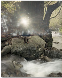
Shankara Serie California Tamaño 60 x 75 cm. Impresión realizada con tintas pigmentadas Epson Ultrachrome HDR sobre papel CANSON Platine Fibre Rag