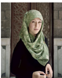
Wafa Serie Siria Tamaño 60 x 75 cm. Impresión realizada con tintas pigmentadas Epson Ultrachrome HDR sobre papel CANSON Platine Fibre Rag