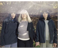
CFR Serie California Tamaño 60 x 75 cm. Impresión realizada con tintas pigmentadas Epson Ultrachrome HDR sobre papel CANSON Platine Fibre Rag