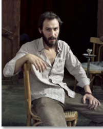
Carlo Serie Siria Tamaño 60 x 75 cm. Impresión realizada con tintas pigmentadas Epson Ultrachrome HDR sobre papel CANSON Platine Fibre Rag