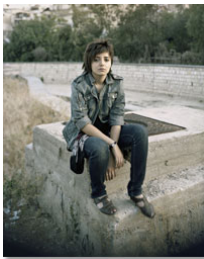
Rudy Serie Siria Tamaño 60 x 75 cm. Impresión realizada con tintas pigmentadas Epson Ultrachrome HDR sobre papel CANSON Platine Fibre Rag