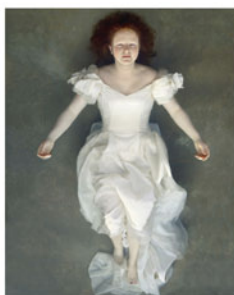
Ofelia Weston Serie California Tamaño 60 x 75 cm. Impresión realizada con tintas pigmentadas Epson Ultrachrome HDR sobre papel CANSON Platine Fibre Rag