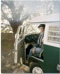
Annie Serie California Tamaño 60 x 75 cm. Impresión realizada con tintas pigmentadas Epson Ultrachrome HDR sobre papel CANSON Platine Fibre Rag