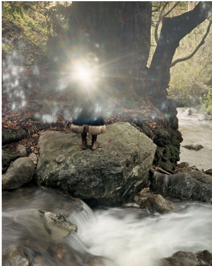
Shankara Serie California Tamaño 60 x 75 cm. Impresión realizada con tintas pigmentadas Epson Ultrachrome HDR sobre papel CANSON Platine Fibre Rag