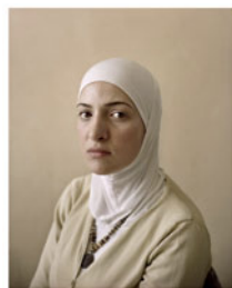
Marjan Serie Siria Tamaño 60 x 75 cm. Impresión realizada con tintas pigmentadas Epson Ultrachrome HDR sobre papel CANSON Platine Fibre Rag