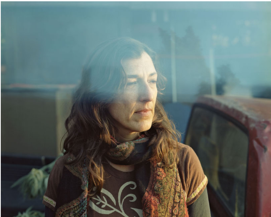
Lisa Serie California Tamaño 60 x 75 cm. Impresión realizada con tintas pigmentadas Epson Ultrachrome HDR sobre papel CANSON Platine Fibre Rag